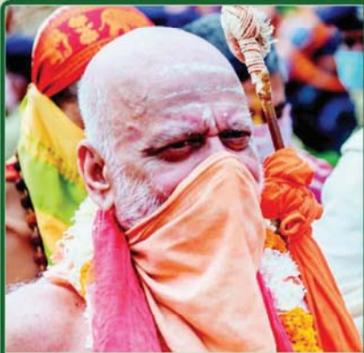
ଜଗଦ୍ଗୁରୁ ସ୍ଵାମୀ ନିଷ୍ଠଳାନନ୍ଦ ସରସ୍ଵତୀ ରଥାରୂଢ଼ ଶ୍ରୀବିଗ୍ରହମାନଙ୍କୁ ଦର୍ଶନ କରିବାକୁ ଯାଉଛନ୍ତି ।