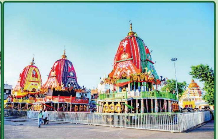
ଗୁଣ୍ଡିଚା ମନ୍ଦିର ସମ୍ମୁଖରେ ତିନି ରଥ