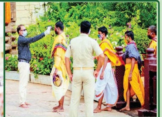
ରଥଯାତ୍ରାରେ ନିୟୋଜିତ ହେବା ପୂର୍ବରୁ ସେବାୟତମାନଙ୍କ ଥର୍ମାଲ୍ ସ୍କାନିଂ କରାଯାଉଛି ।