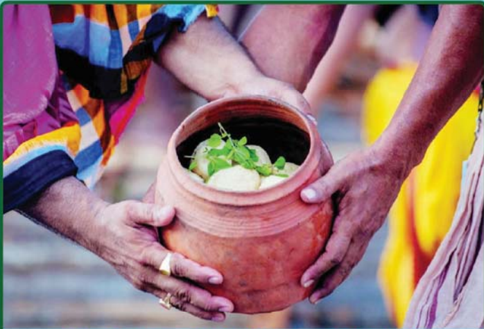
ତା. ୪.୭.୨୦ରେ ନୀଳାଦ୍ରି ବିଜେ ଅବସରରେ ମହାପ୍ରଭୁଙ୍କୁ ରସଗୋଲା ସମର୍ପଣ କରାଯାଉଛି ।