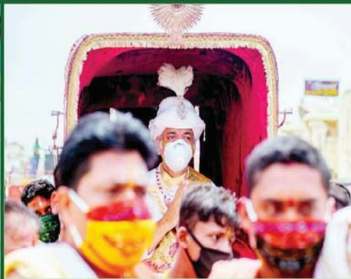
ଗଜପତି ମହାରାଜ ଶ୍ରୀ ଦିବ୍ୟସିଂହ ଦେବ ରଥାରୂଢ଼ ବିଗ୍ରହମାନଙ୍କର ଛେରାପହଁରା ନିମନ୍ତେ ତାମକାନରେ ବିଜେ କରୁଛନ୍ତି ।