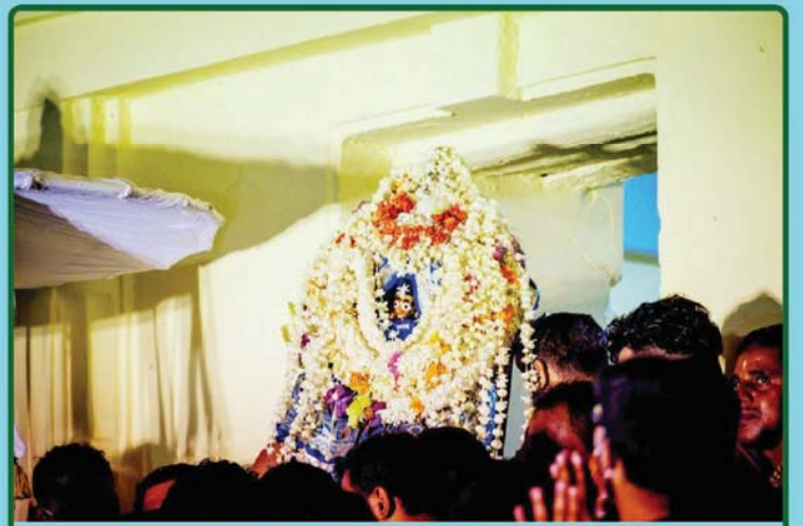
ତା. ୪.୭.୨୦ରେ ନୀଳାଦ୍ରି ବିଜେ ଅବସରରେ ଝହାଁଣୀ ମଣ୍ଡପରେ ମା' ଲକ୍ଷ୍ମୀ ଠାକୁରାଣୀ ।