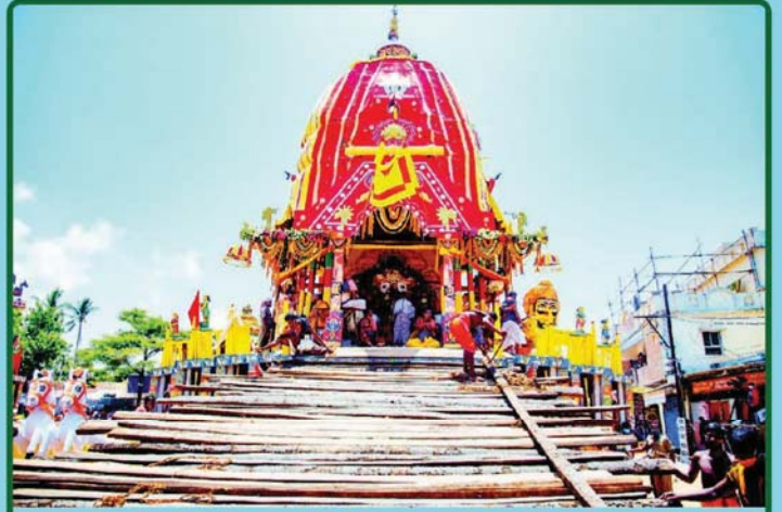
ତା. ୧.୭.୨୦ରେ ବାହୁଡ଼ା ଯାତ୍ରା ଅବସରରେ ନନ୍ଦିଘୋଷ ରଥରେ ଶ୍ରୀଜଗନ୍ନାଥ ମହାପ୍ରଭୁ ବିରାଜମାନ ।