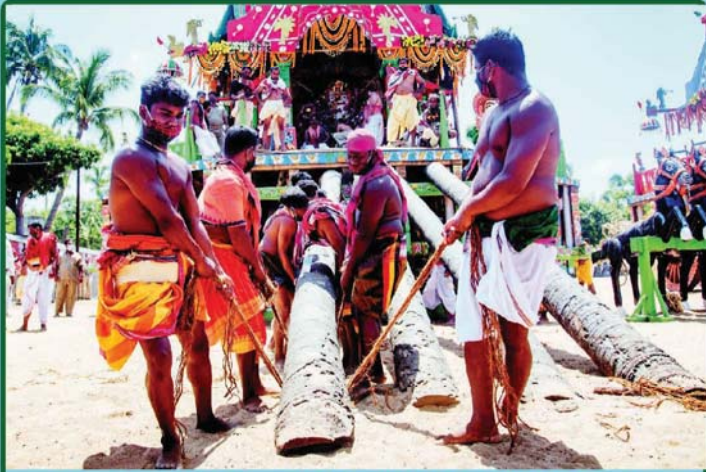
ତା. ୧.୭.୨୦ରେ ବାହୁଡ଼ା ଯାତ୍ରାରେ ରଥଟଣା ନିମନ୍ତେ ତାଳଧୁଳ ରଥରୁ ଊରମାଳ ଫିଟା ଯାଉଛି ।