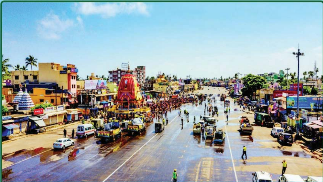
ତା. ୧.୭.୨୦ରେ ବାହୁଡ଼ା ଅବସରରେ ନନ୍ଦିଘୋଷ ରଥକୁ ସେବକମାନେ ସିଂହଦ୍ୱାର ନିକଟକୁ ଚାଣି ନେଉଛନ୍ତି ।