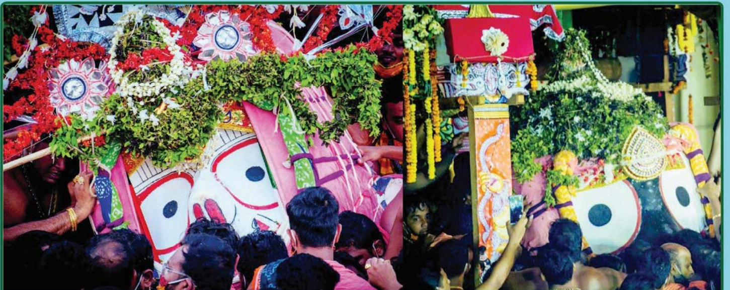
ତା. ୪.୭.୨୦ରେ ମହାପ୍ରଭୁଙ୍କ ନୀଳାଦ୍ରି ବିଜେ ।