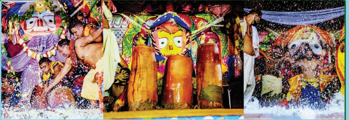
ତା. ୩.୭.୨୦ରେ ରଥରେ ଶ୍ରୀବିଗ୍ରହମାନଙ୍କ ଅଧରପଣା ନୀତି ସମ୍ପାଦିତ ହେଉଛି ।