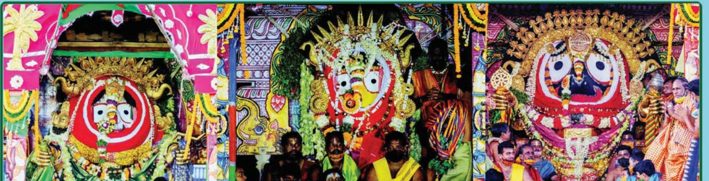
ତା. ୨.୭.୨୦ରେ ସିଂହଦ୍ୱାର ସମ୍ମୁଖରେ ରଥ ଉପରେ ଶ୍ରୀବିଗ୍ରହମାନଙ୍କ ସୁନାବେଶ ।